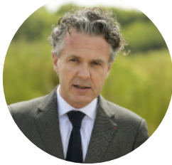
Christophe Béchu, ministre de la Transition écologique et de la Cohésion des territoires