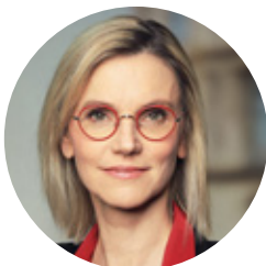
Agnès Pannier-Runacher ministre de la Transition énergétique

Les mots du Président de la République, prononcés à Marseille le 16 avril 2022, sont sans équivoque : ce quinquennat « sera écologique ou ne sera pas ». Cette ambition nous impose de tout faire pour placer notre pays sur la trajectoire de la neutralité carbone à horizon 2050. De tout faire, également, afin de devenir le premier grand pays au monde à sortir de sa dépendance aux énergies fossiles. De tout faire, enfin, pour préserver la biodiversité, circulariser notre économie et réduire durablement notre empreinte environnementale.